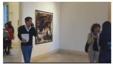
La fotografia e il suo supporto: la ricerca di Elisa Sighicelli AskaneWS Potrebbe interessarti anche...

Case Aler, Tar Lombardia: giusta indagine patrimoniale a stranieri AskaneWS