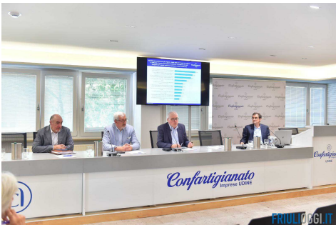
Artigiani in Friuli, cresce il fatturato, ma a