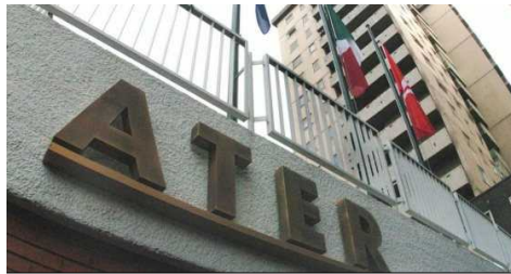
Edilizia residenziale, una dote di 12 milioni alle Ater del Friuli Venezia Giulia