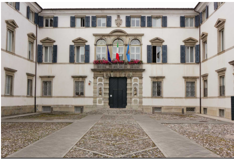
Star del cinema, progetto esclusivo dell'Università di Udine