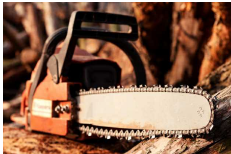
Tredicenne si amputa le dita della mano con