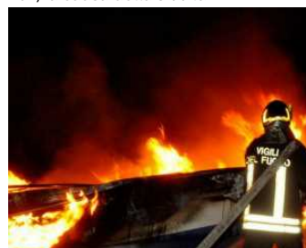
Incendi in Italia, 15 anni per ricostruire i boschi andanti in fiamme