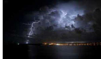
Maltempo si abbatte dopo -61% pioggia a settembre