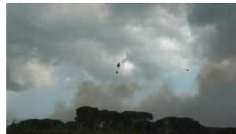
Incendi, triplicati i boschi in fiamme nel 2017 a causa della siccità