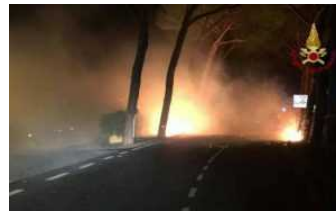
Incendi, con Monte Serra 13,600 ettari in fiamme