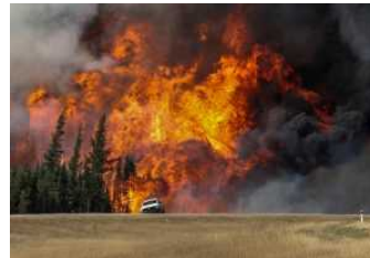
Incendi: Coldiretti, allarme più alto di sempre in estate 2016

«Abbandono, politiche di riforestazione sbagliate e ritardi nella pianificazione e gestione forestale sostenibile ci restituiscono un patrimonio che oggi ha bisogno di un nuovo progetto culturale e politico, che metta al centro la montagna, le aree interne e le condizioni di vita di questi territori - dichiara Stefano Ciafani, presidente di Legambiente -. Il ruolo delle nostre foreste deve tornare ad essere al centro dell'agenda politica del Paese, puntando su due elementi chiave: la tutela della biodiversità e le produzioni green. Vogliamo immaginare un vero e proprio progetto per le foreste d'Italia garantendone il ruolo sociale, economico e ambientale, coinvolgendo le comunità locali in una strategia di lungo periodo. Le foreste preservano la biodiversità, prevengono l'erosione del suolo, fungono da deposito naturale di carbonio, ostacolando il surriscaldamento globale, e costituiscono la base per nuove economie locali, sia per la loro funzione nell'ambito di una complessa filiera produttiva ed energetica del legno, sia per il loro uso in chiave turistica, ricreativa e culturale».