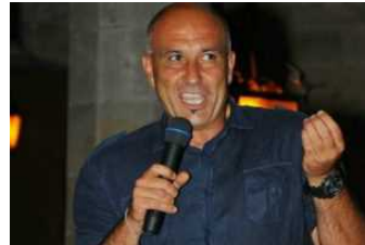
Amatrice, martedì 9 maggio il Forum Nazionale delle Foreste